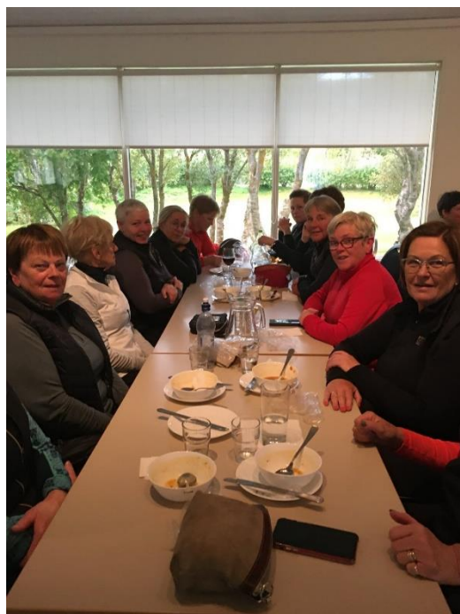
Mynd 7: Stelpurnar okkar að gæða sér að súpu

Hatta- og pilsamótið var haldið þann 24. júlí með sannkölluðum glæsibrag. Veðrið lék við okkur að vanda. Þátttaka var góð eins og ævinlega á þessu móti. Spiluð var 9 holu punktkeppni þar sem veitt voru verðlaun fyrir 3 efstu sætin en einnig fyrir ýmislegt annað skemmtilegt. Snæddur var dýrindiskvöldverður að hætti Jóns Vídalín og skemmtu konur sér vel. Í lok sumars var áætluð haustferð til Húsavíkur. Undirbúningur hafði staðið yfir og var í raun og veru allt að verða klárt, þegar aflýsa þurfti ferðinni vegna veirunnar. Í staðinn var ákveðið að halda haustspil og borða saman súpu að spili loknu. Þessu var vel tekið hjá félagskonum og mættu 46 konur til leiks. Það var virkilega gott og gaman að geta lokið golfsumrinu á þennan jákvæða hátt.