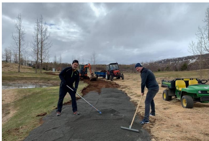
Mynd 4: Vaskir GA félagar við stígagerð á 11. holu

mæta og taka til hendinni við völlinn, rúmlega 75 manns mættu þetta árið og fengu að spila 10 holur á vellinum eftir erfiðan dag út á velli í hinum ýmsu verkefnum.