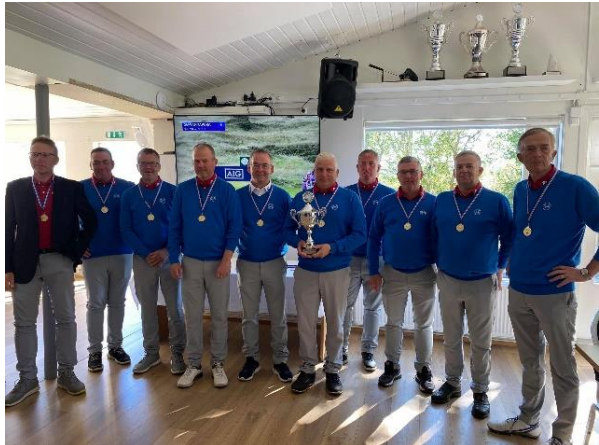
Mynd 9: Strákarnir okkar glaðir með bikarinn