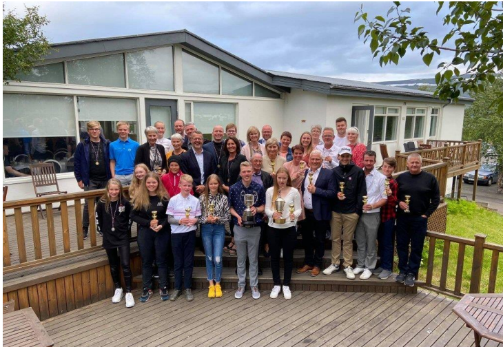
Mynd 2: Verðlaunahafar á Akureyrarmótinu

Að venju voru mörg stórmótin í ágústmánuði en má þar helst nefna Icewear bombuna, Hjóna- og paramót Golfskálans og GA, Höldur Open og Opna FootJoy og Titleist mótið. 156 þátttakendur voru í bombunni, 208 í hjóna- og parakeppninni, 204 í Höldur Open og 126 í Opna FootJoy og Titleist mótinu. Svokölluð stórmót má kalla þessi mót og var því nóg um að vera í ágústmánuði en fleiri mót voru einnig haldin. Aldrei hafa áður verið eins margir í Höldur Open eins og árið 2020 og er ljóst að það er að verða eitt að stærstu mótum landsins. Vegna Covid-19 faraldursins reyndist ekki hægt að halda hefðbundið lokahóf á Hjóna- og parakeppni Golfskálans og GA en við fundum lausnir á því ásamt Vídalín veitingum og fóru keppendur saddir og glaðir heim eftir hringinn á laugardeginum. Íslandsmót golfklúbba eldri kylfinga var haldið á Jaðarsvelli seinnipart ágústmánaðar og fór það svo að sveit okkar GA manna gerði sér lítið fyrir og varð Íslandsmeistari á heimavelli eftir sigur í úrslitaleiknum á móti sveit GKG, frábær árangur hjá körlunum okkar sem voru klúbbum til sóma.