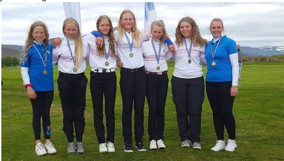
Mynd 11: 15 ára og yngri sveit stúlkna hafnaði í 3.sæti á Íslandsmótinu

Í apríl á þessu ári var búið að skipuleggja æfingaferð fyrir iðkendur til Novo Sancti Petri á Spáni en því miður gátum við ekki farið í hana vegna heimsfaraldursins sem reið yfir. Við neyddumst því til að taka okkur frí í vor frá skipulögðum æfingum áður en útiæfingar gátu hafist. Við þjálfarar sátum ekki auðum höndum, heldur sendum við frá okkur heimaæfingar og æfingaáætlanir á iðkendur og opnuðum vefsíðu þar sem við hlóðum upp safni af gagnlegum æfingum sem hægt er að framkvæma heima.