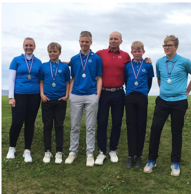
Mynd 12: 15 ára og yngri sveit drengja hafnaði í 2.sæti á Íslandsmótinu