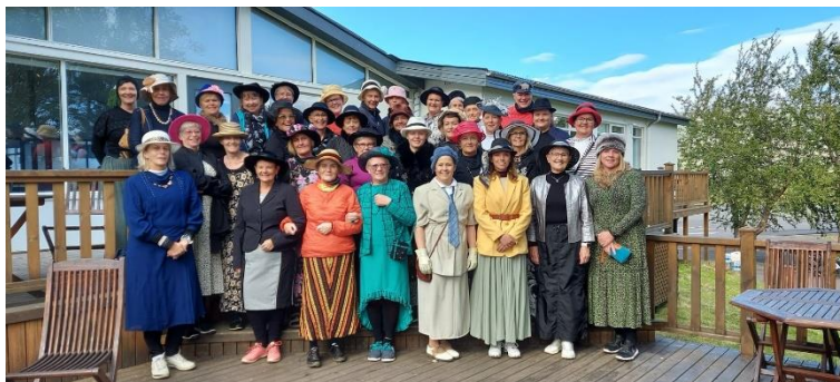
Mynd 6: Hatta- og pilsamótið var vel heppnað

Kvennanefnd stóð fyrir vön-óvön kvennaspili þrisvar sinnum yfir sumarið. Ýmsar útgáfur af golfi voru spilaðar og áhersla lögð á að bjóða nýjar konur velkomnar og að hafa gaman saman. Fyrsta kvennaspilið var haldið 8. júní. Ákveðið var að hafa þetta með veglegri hætti þar sem ekki hafði verið hægt að halda vorfundinn