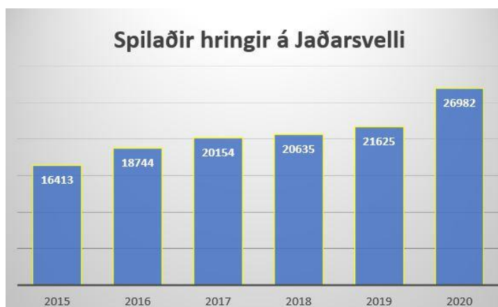
Tafla 4: Spilaðir hringir á Jaðarsvelli 2020

Aldrei hafa eins margir hringir verið spilaðir á Jaðarsvelli eins og sumarið 2020 eða 26.982 hringir. Það er mikið umstang sem tengist svona umferð á völlinn og starfsmenn okkar á vellinum eiga hrós skilið fyrir vel unnin störf í sumar og hlökkum við mikið til næsta árs. Þá munum við halda Íslandsmótið í golfi í ágúst og munum við halda áfram þeirri góðu vinnu sem hefur átt sér stað undanfarin ár og hafa völlinn eins góðan og hægt er.