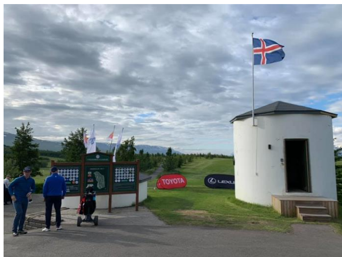
Mynd 3: Það var stemming á Arctic Open

Arctic Open mótið fór fram dagana 24.-27. júní og má sjá nefndarmeðlimi hér fremst í skýrslunni. Helstu samstarfsaðilar mótsins voru Flugfélag Íslands, Isavia, MS, FootJoy á Íslandi og Toyota á Íslandi. Við hjá GA viljum þakka þessum sérstaklega fyrir stuðninginn ásamt öðrum samstarfs- og styrktaraðilum. Alls voru 224 þátttakendur í Arctic Open í ár sem er frábær þátttaka. Því miður voru fáir erlendir kylfingar í mótinu í ár sökum Covid-19 en meiri hluti þeirra sem komst ekki í ár skráði sig strax í mótið 2021 og því er von á stóru mótí næsta ár. Völlurinn var í flottu standi þegar mótið hófst og eiga vallarstarfsmenn sem og veðurguðirnir miklar þakkir skilið fyrir þeirra störf í aðdraganda mótsins.