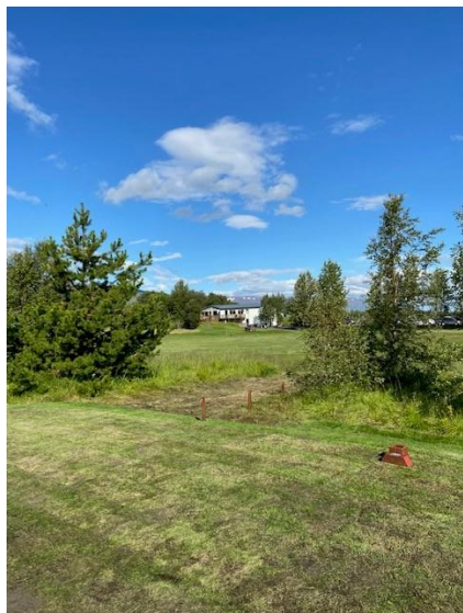
Mynd 5: Nýr rauður teigur á 10. holu

Nokkrar minniháttar framkvæmdir voru á vellinum í ár, nýr rauður teigur á 10. holu sem kom mjög vel út var vígður þann 6. ágúst. Teigurinn gerir holuna viðráðanlegri fyrir þá sem slá stutt og beint og er mikil ánægja með hann. Þá var lagður stígur á 11. og 14. holu fyrir umferð og á haustmánuðum var farið í að byggja upp nýjan hvítan teig á 17. holu sem verður tekinn í notkun á næsta ári og lengir holuna umtalsvert sem verður gaman að sjá. Einnig var farið í drenvinnu á 16. og 6. braut nú í haust og vonumst við til þess að það muni skila góðum árangri næsta sumar.