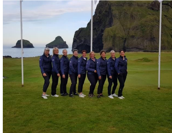
Mynd 10: Stelpurnar okkar í Vestmannaeyjum