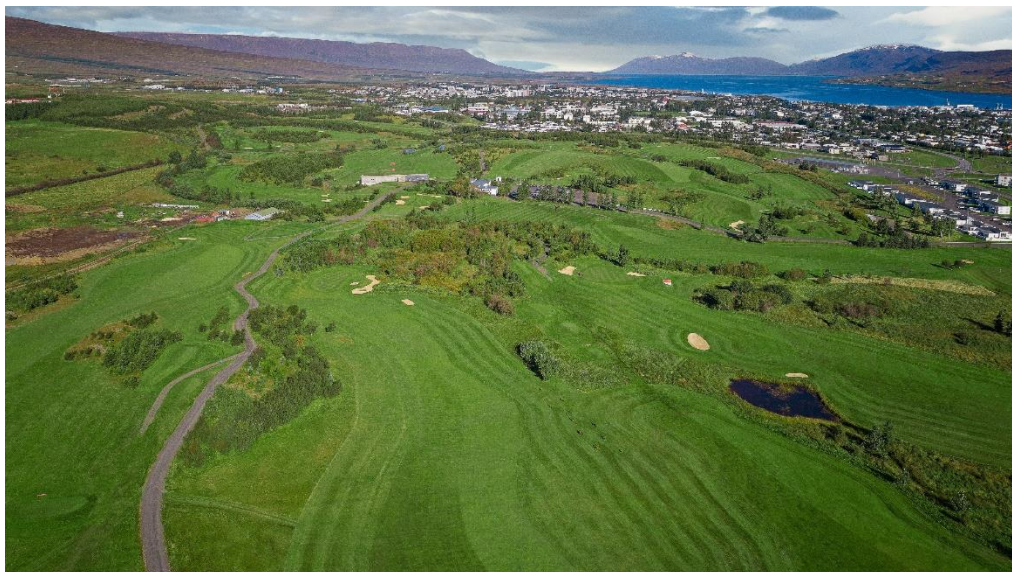
Mynd 4:

Í lok sumars eða 7. september var farið í haustferð. Að þessu sinni var farið í dagsferð á Sauðárkrók þar sem við fengum góðar móttökur. Sauðkrækingar skipulögðu 18 holu golfmót fyrir okkur sem spilað var í töluverðum vindi en nánast spánarhita. Að móti loknu var dýrindismatur og almenn gleði að hætti golfkvenna á Kaffi Krók. Þátttaka í ferðina var góð eða rúmlega 40 konur.