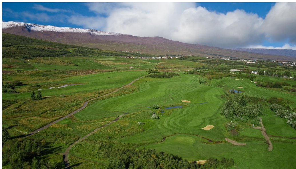
Mynd 2