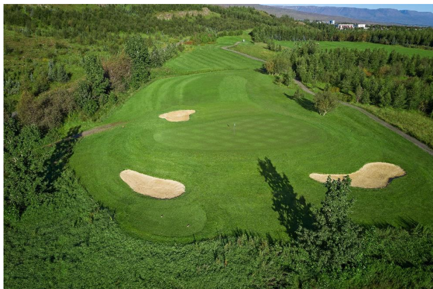
Mynd 1:

Uppbygging á þar 3 vellinum okkar er nú lokið og hefur það sýnt sig að fleiri og fleiri nota hann. Bæði ungir sem eru að byrja í golfi eins þeir sem vilja æfa stutta spilið. Eins var unnið að því að laga meira til á æfingarsvæði félagsins.