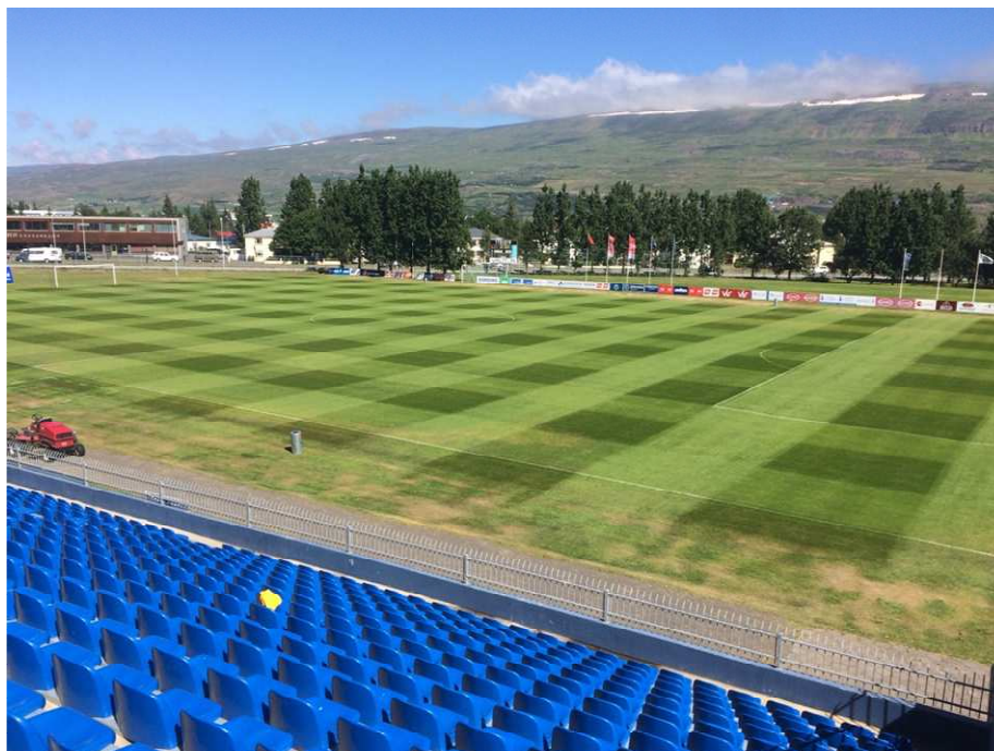
Akureyrarvöllur 18. júlí 2016

Samstarf GA við KA og Þór vegna umhirðu fótboltasvæða hélt áfram og var það mat manna að fótboltavellirnir hafi sjaldan verið betri. Er það ekki síst að þakka frábærri samvinnu beggja aðila.