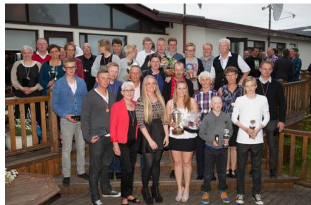
Mynd 4: Sigurvegarar á Akureyrarmóti

Arctic Open vegna þess hversu seint völlurinn var til vegna óhagstæðrar veðráttu.