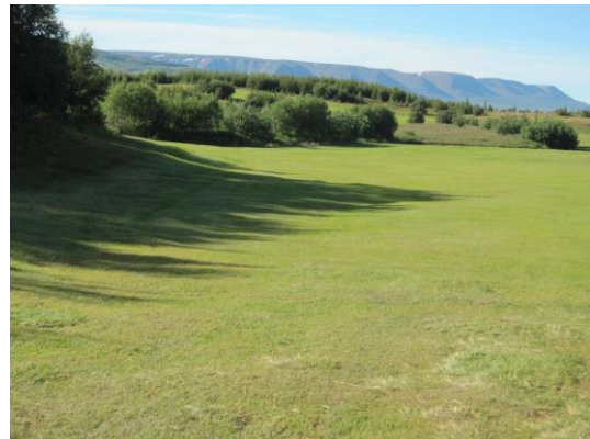
Mynd 11: Frá Jaðarsvelli

Eitt af markmiðum nýliðanefndar er á taka á móti nýliðum sem eru að stíga sín fyrstu skref í golfi, það er gert með reglunámskeiði á vorin og nýliðakvöldum þar sem vanir kylfingar spila með óvönum kylfingum. Með þessu fyrirkomulagi ná nýliðar að kynna golfíþróttinni og öðrum kylfingum betur og hraðar. Það á að vera markmið allra kylfinga í GA að stuðla að fjölgun félagsmanna og sýna nýjum kylfingum þolinmæði og stuðning. Sameiginlegt markmið okkar allra er að nýliðar upplifi þá tilfinningu að þeir séu velkomnir í GA. Nauðsynlegt er að útbúa svæði innan vallar þar sem nýliðar geta spilað 6-9 (stuttar) holur. Meðan það svæði er ekki til þá er oft erfitt að fá óvana fullorðna einstaklinga til að ganga í klúbbinn.