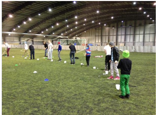
Mynd 9: Frá æfingu í Boganum

Í maí var haldið í æfingaferð með unglíngahópin ásamt keppnishópi fullorðinna. Farið var í Borgarnes, gíst þar og spílað auk þess sem flestir tóku þátt í golfmóti á Akranesi.