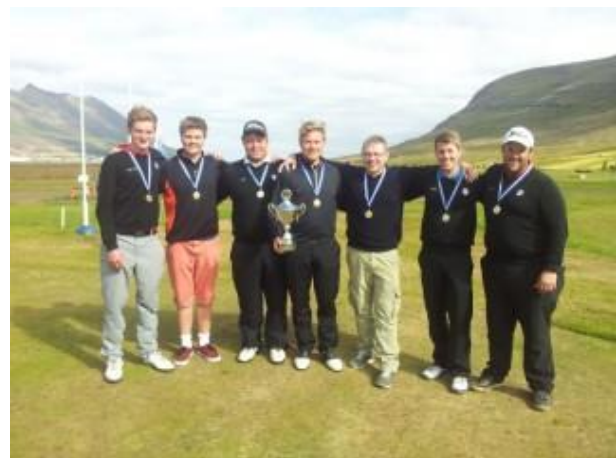
Mynd 15: Karlasveit GA 2013