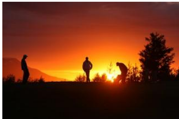
Mynd 8: Frá Arctic Open

Eins og svo oft áður þurfti að leggja nótt við dag síðustu daga fyrir mót til að tryggja að allir hlutir væru í fullkomnu lagi. Fjölmarginir GA félagar hjálpuðu til við undirbúning og framkvæmd mótsins og er þeim þakkað kærlega fyrir þá framgöngu. Framkvæmd mótsins tókst í alla staði vel og var klúbbum til mikils sóma. Veður var heldur kalt báða keppnisdaga en að venju létu keppendur það ekki á sig fá. Miðnætursólin skartaði sínu fegursta fyrri keppnisdaginn.