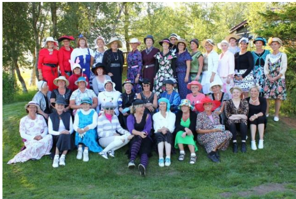
Mynd 13: Frá Hatta- og pílámóti

Kvennanefnd boðaði til vorfundar að Jaðri þann 1. mars. og var góð mæting að vanda. Ný kvennanefnd tók til starfa. Á vorfundi eru línur lagðar fyrir sumarið, - ákveðið var að spila 9 holu golf. 5 sinnum á miðvikudagskvöldum og taka þá með óvanar konur, þessir tímar voru vel sóttir.