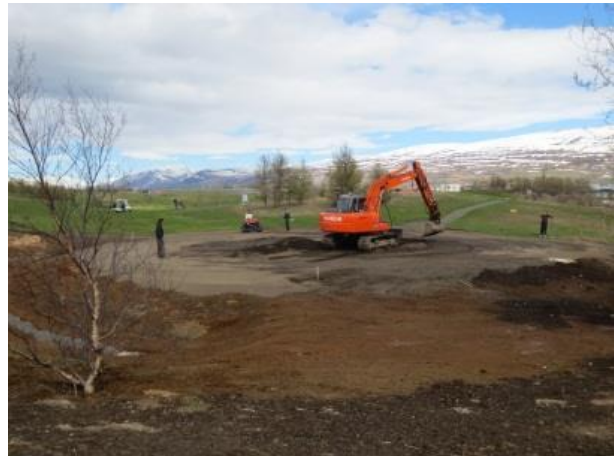
Mynd 3: Frá framkvæmdum við 2. flöt

Framkvæmdir voru að venju miklar, allt kapp var lagt á að klára 2. flöt fyrir Arctic Open.