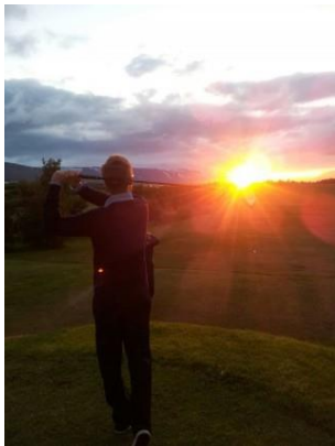
Mynd 7: Frá Arctic Open

Arctic Open mótið var haldið dagana 28. – 30. júní.