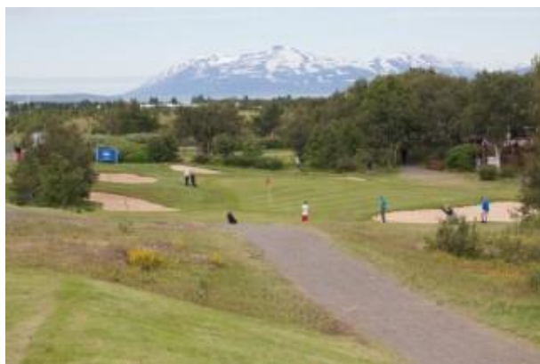
Mynd 12: 18. brautin

Nýliðakvöld voru 4 á þessu ári en byrjuðu óvenju seint. 25. júní var fyrsta kvöldið og 23. júlí var síðasta kvöldið. Mæting var yfirleitt ágæt en samtals 28 óvanir mættu á þessi 4 mót. Sumir mættu einu sinni en aðrir oft. Vanir spilarar voru líka duglegir að mæta og þökkum við þeim kærlega fyrir. Samtals tóku um 50 manns þátt í þessum nýliðakvöldum og spiluðu 90 hringi.